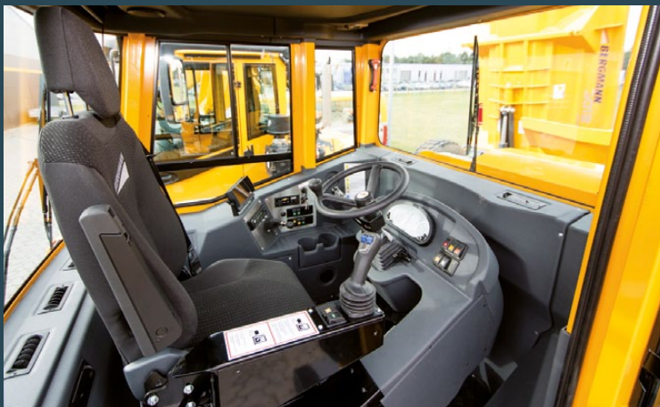
Kabine mit Drehsitz und intuitiver Bedienung.