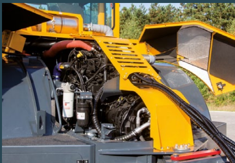
Gute Zugänglichkeit zu allen Wartungsstellen durch patentiertes Haubensystem.