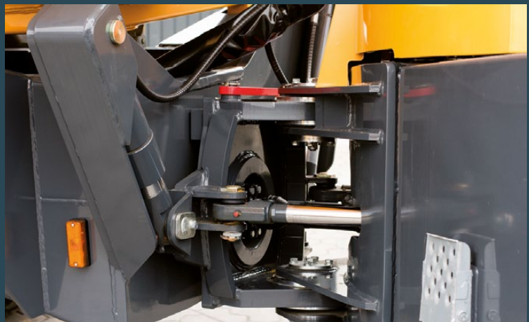
Knick-Pendelgelenk mit Stabilisierungszylinder.